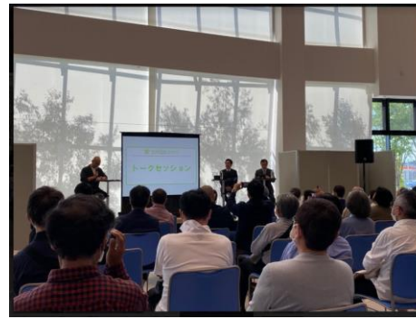
写真3 トークセミナー「目の疾患について」