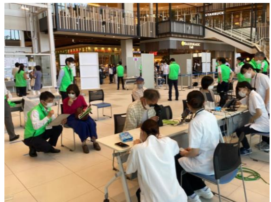
写真1 MEOCHECK を使った目の健康チェック