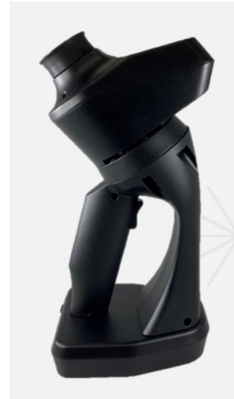
図1 簡易型目の健康セルフチェック装置 MEOCHECK