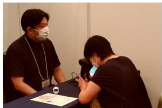
図2 MEOCHECK を使った眼の健康チェック